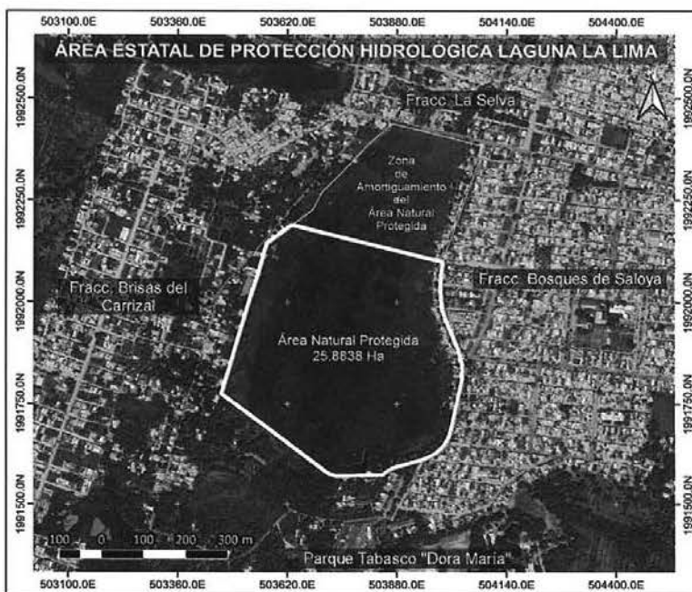
Polígono del Área Natural Protegida, Área Estatal de Protección Hidrológica "Laguna La Lima".