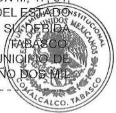
OVIDIO SALVADOR PERALTA SUAREZ PRESIDENTE MUNICIPAL

EN CUMPLIMIENTO A LO DISPUESTO POR LOS ARTICULOS 29 FRACCION III, 47, 51, 52, 53, 54 y 65 FRACCION II, DE LA LEY ORGANICA DE LOS MUNICIPIOS DEL ESTADO DE TABASCO, SE PROMULGAN LA PRESENTE FE DE ERRATAS , PARA SU DEBIDA PUBLICACION Y OBSERVANCIA, EN LA CIUDAD DE COMALCALCO, TABASCO, RESIDENCIA OFICIAL DEL AYUNTAMIENTO CONSTITUCIONAL DEL MUNICIPIO DE COMALCALCO, TABASCO, A LOS 29 DIAS DEL MES DE AGOSTO DEL AÑO DOS MIL VEINTICINCO. -----