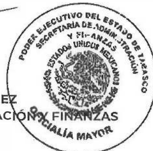
VANIA ELIZABETH DE ALBA GONZÁLEZ OFICIAL MAYOR DE LA SECRETARÍA DE ADMINISTRACIÓN Y FINANZAS

Dado en la Ciudad de Villahermosa, Capital del Estado de Tabasco, el día quince del mes de abril del año dos mil veinticinco.