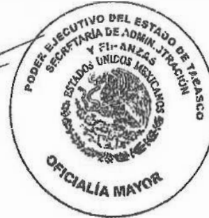
VANIA ELIZABETH DE ALBA GONZÁLEZ OFICIAL MAYOR DE LA SECRETARÍA DE ADMINISTRACIÓN Y FINANZAS

Dado en la Ciudad de Villahermosa, Capital del Estado de Tabasco, el día quince del mes de abril del año dos mil veinticinco.