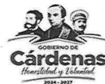
TABLA 3.- REMUNERACIONES EXTRAORDINARIAS APLICABLES A CARGO DE SINDICO, REGIDORES, DELEGADOS Y JEFES DE SECTOR DEL AYUNTAMIENTO CONSTITUCIONAL DE CÁRDENAS: